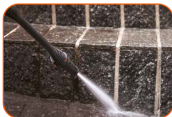
Limpeza de pátios, calçadas e terraços