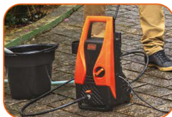
Função de auto escovamento