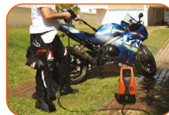
Limpeza de bicicletas, carros e motos